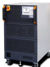
大容量直流電子負荷