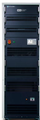
再生型直流電子負荷